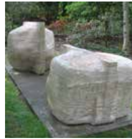
Between by Adolf Ryszka