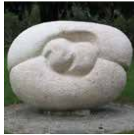
Meta Morphosis by Olga Jancic