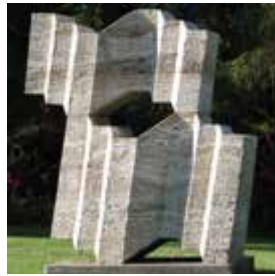
For the Botanical Garden by Hiromi Akiyama