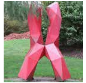
Throne of Nezahualcoyotl by Sebastian